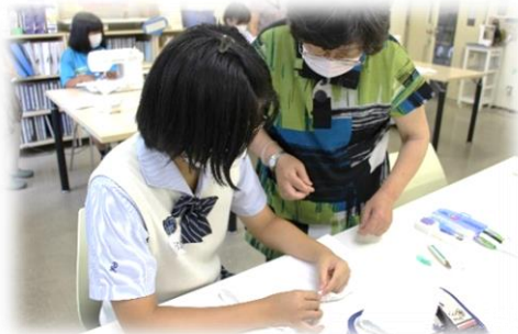
手縫いでちくちく雑巾づくり