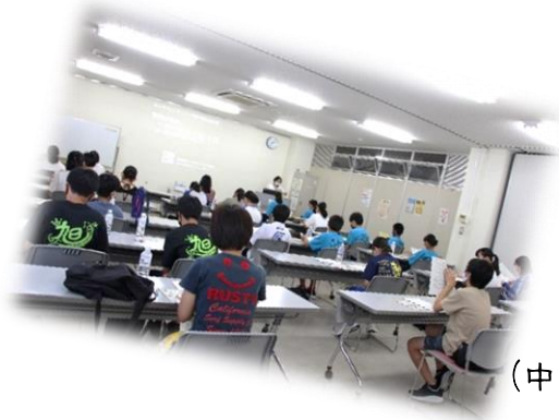
事前研修会 (中学生・一般向け)