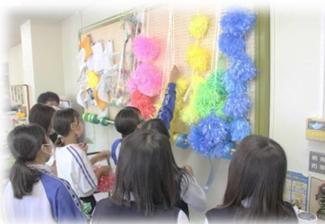
「いっぱいできたね」 「子ども達は喜んでくれるかな(^)」