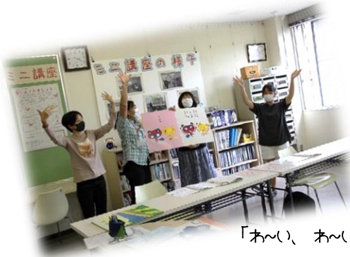
「おーい、おーい」「おははは〜」 絵本の読み聞かせの練習です