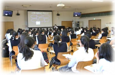
事前研修会 (高校生向け)