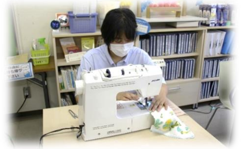
ミシンでカタカタ信筒子 良く♪