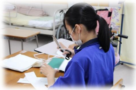
はさみでチョキチョキ 手作りハガキ用の紙すきの準備中