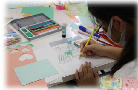
高齢者の方を 想って…